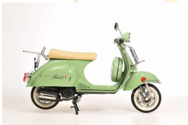
SCOOTER 125 cm 3 (50 € / jour - 120 € ½ semaine - 180 € / semaine)