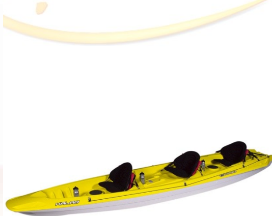
Kayak de mer (50 € / jour / 2 pers. - 90 € / 3 jours / 2 pers.)